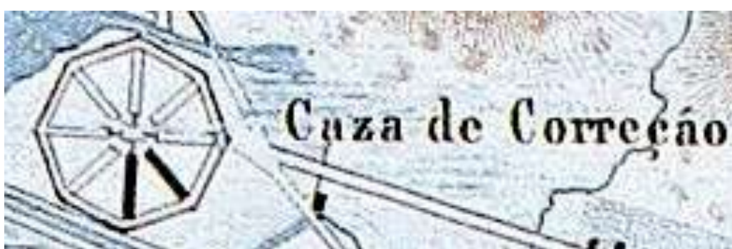
4. Desenho da CPCT idealizado por Pedro Weyll, indicando a conclusão de dois raios.