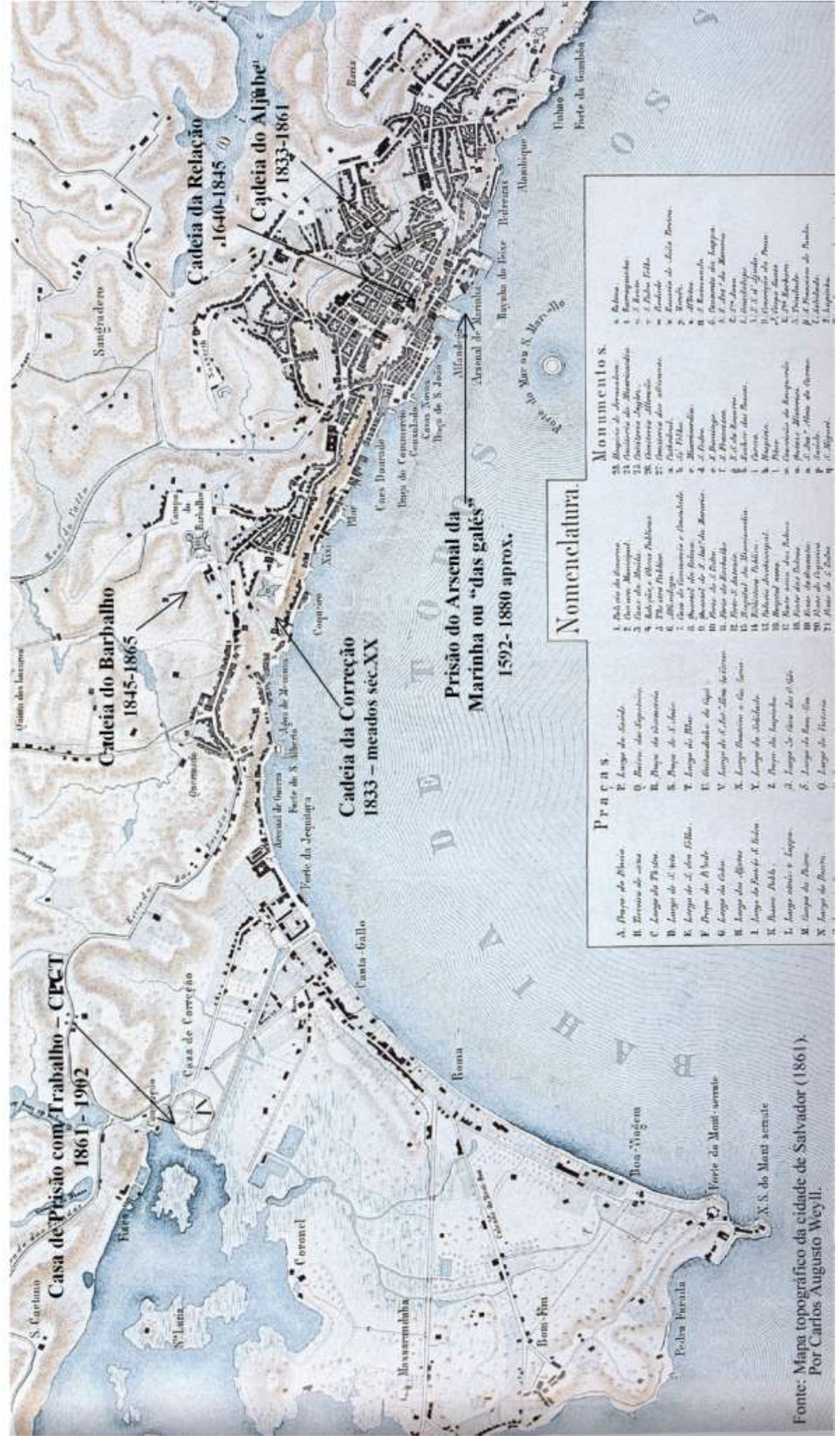
Fonte: Mapa topográfico da cidade de Salvador (1861). Por Carlos Augusto Weyll.