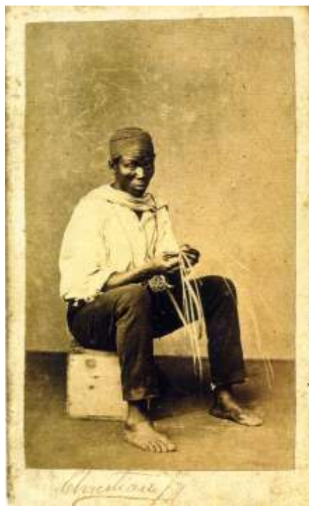
5. Negro trançando palha para fazer cesto, 1864.

Na petição endereçada ao delegado, eles disseram necessitar do dinheiro da venda dos balaies para comprarem “couza que lhes é mister”. 76 Tudo indica que eles fabricavam seus balaies na prisão e, ao serem proibidos, reagiram contra a decisão. Confeccionar objetos de palha como chapéus, cestos, esteiras e muitos outros objetos eram atividades comuns entre os africanos para garantirem suas subsistências. A vivência desses africanos livres na instituição, reproduzindo o cotidiano da vida escrava da cidade, revela algumas particularidades do processo de adaptação da penitenciária na sociedade baiana oitocentista