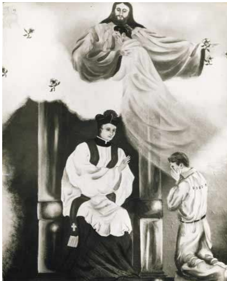
2. Representação de um preso se redimindo dos seus crimes perante a Igreja. Acervo da Eastern Penitentiary, fundada em 1790 na Pensilvânia.

Os dois sistemas – Auburn e Pensilvânia - dividiram as opiniões dos reformadores estrangeiros e grandes debates giraram em torno de qual deles seria o melhor. Esse conflito de opiniões também tem presença marcante nas discussões dos reformadores baianos. Existia uma corrente muito poderosa formada por juristas, políticos e religiosos a favor do sistema da Pensilvânia. Um pensamento atribuído a John Fremont era usado por muitos defensores do sistema da Pensilvânia : “não seria justo que um homem honrado que por um erro da justiça é atirado á prisão fique arriscado a encontrar mais tarde um miseravel que o trate como igual”. 101 O sistema da Pensilvânia teve dois importantes defensores, que foram Alex Tocqueville e Gustave de Beaulmont. Segundo esses dois ilustres reformadores, o “sistema da Filadélfia [Pensilvânia] produzia homens mais honestos enquanto que o sistema de Auburn